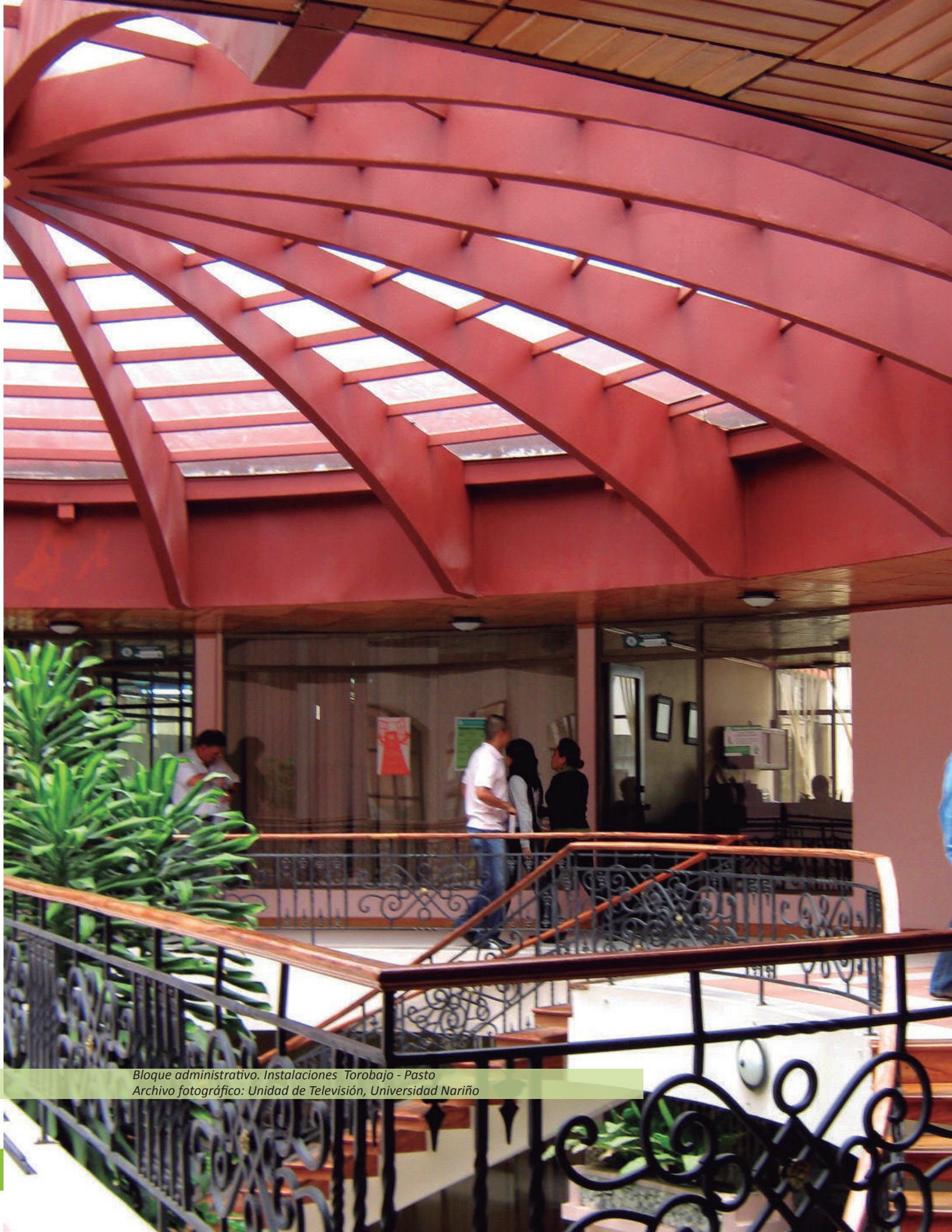
Bloque administrativo. Instalaciones Torobajo - Pasto Archivo fotográfico: Unidad de Televisión, Universidad Nariño