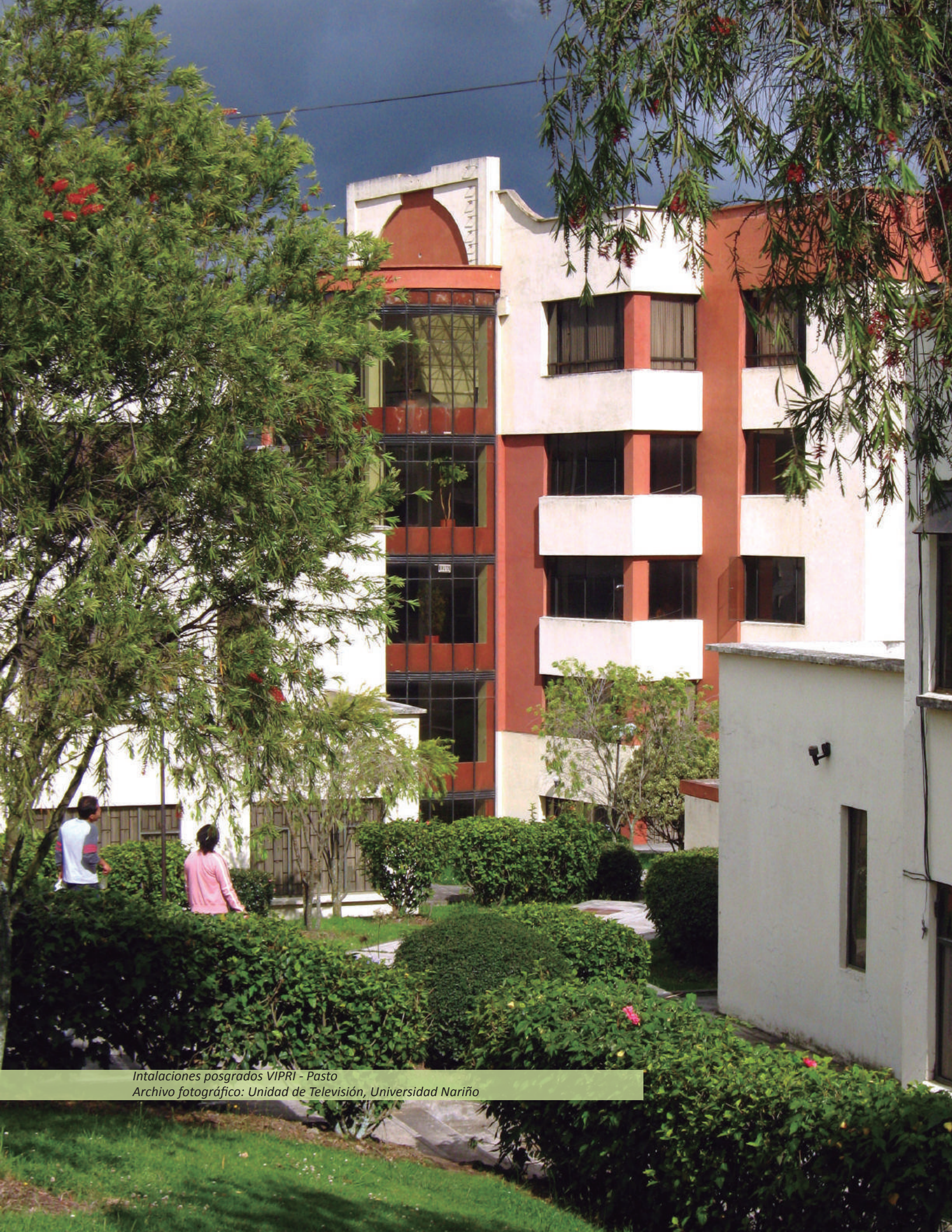
Instalaciones posgrados VIPRI - Pasto