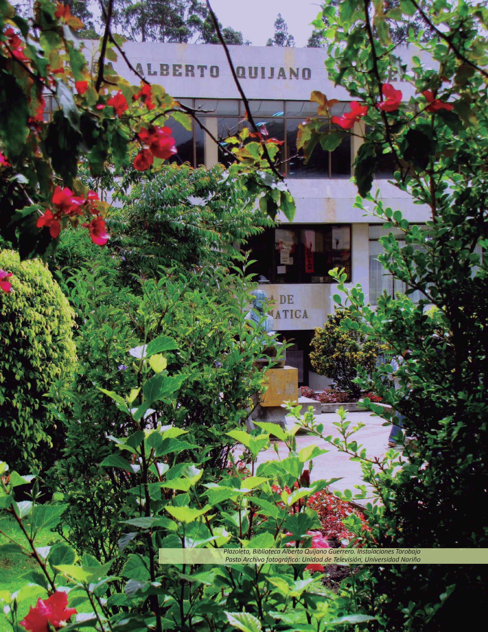
Plazoleta, Biblioteca Alberto Quijano Guerrero. Instalaciones Torobajo Pasto