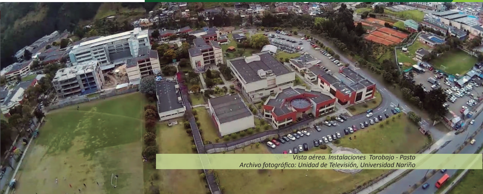
Vista aérea. Instalaciones Torobajo - Pasto

En este sentido, el esfuerzo que realiza la Institución por el mejoramiento en docencia, infraestructura física, apoyo académico, sistemas de información y bienestar, ha sido una constante en las tres extensiones a tal punto que hoy en día la Universidad garantiza el normal funcionamiento de los programas extendidos en los municipios de Tumaco, Ipiales y Túquerres.