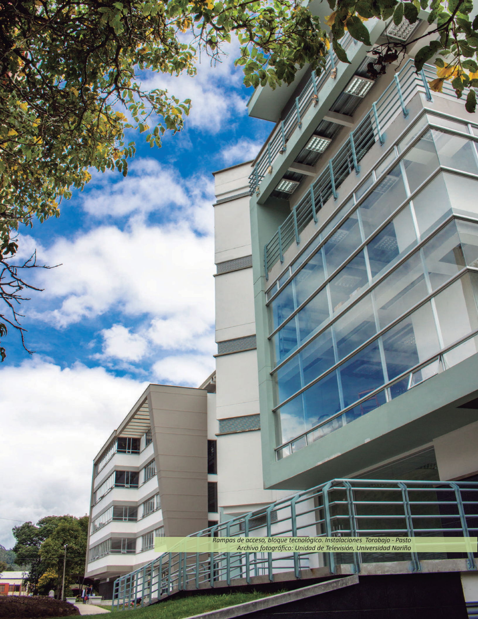
Rampas de acceso, bloque tecnológico. Instalaciones Torobajo - Pasto