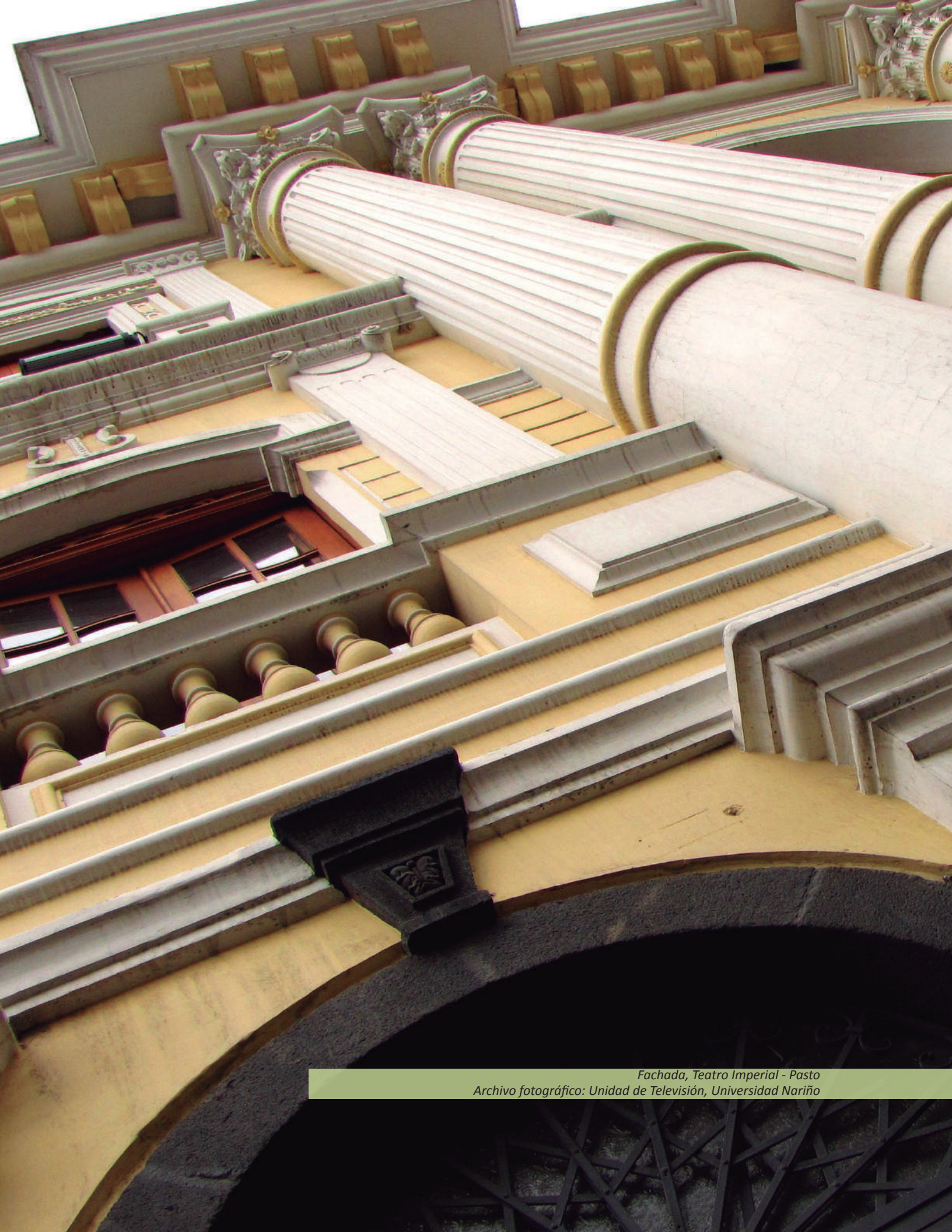
Fachada, Teatro Imperial - Pasto