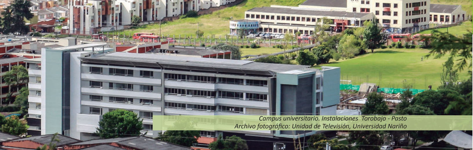
Campus universitario. Instalaciones Torobajo - Pasto