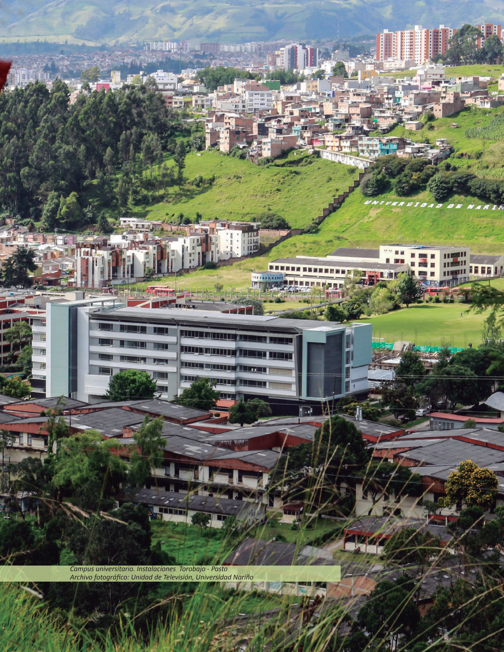
Campus universitario. Instalaciones Torobajo - Pasto