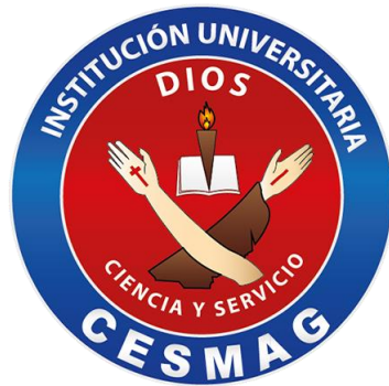
Institución Universitaria CESMAG