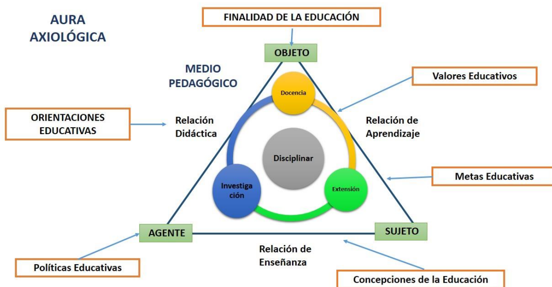
Fig.2. El Aura axiológica, marco normativo que retroalimenta las relaciones pedagógicas de las IES.

La caracterización del Medio Pedagógico (o medios), se regula desde los principios orientadores de la IES, los cuales se constituyen como el Aura Axiológica que engloba la filosofía, los principios y las concepciones, las políticas, las metas educativas, que soportan a la Institución. Ver figura N.2.