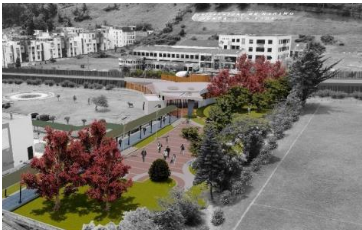
Nueva Plaza para eventos Sede Torobajo