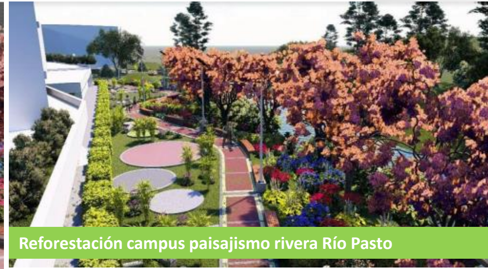
Reforestación campus paisajismo rivera Río Pasto