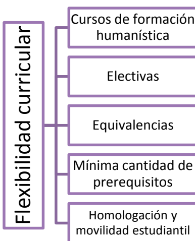
Gráfica 1 Flexibilidad curricular

Entre las ventajas de la flexibilidad del Programa se señalan las siguientes: permite a la comunidad académica definir sus logros académicos y formativos que pretende alcanzar a lo largo del proceso de formación; promueve el desarrollo de la competencia necesaria para el óptimo desarrollo profesional de acuerdo con los fines y los objetivos propios del Programa; suscita la formación interdisciplinaria, ampliando el horizonte de sentido a los conocimientos propios de la disciplina; y, facilita al estudiante un ambiente propicio para el trabajo en equipo, dándole la libertad para que fortalezca sus verdaderos intereses profesionales.