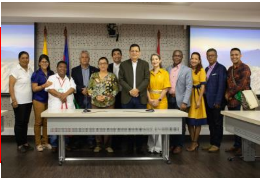
Encuentro Rectores SUE

RECTORA UNIVERSIDAD DE NARIÑO PRESIDE CAPÍTULO SUROCCIDENTE