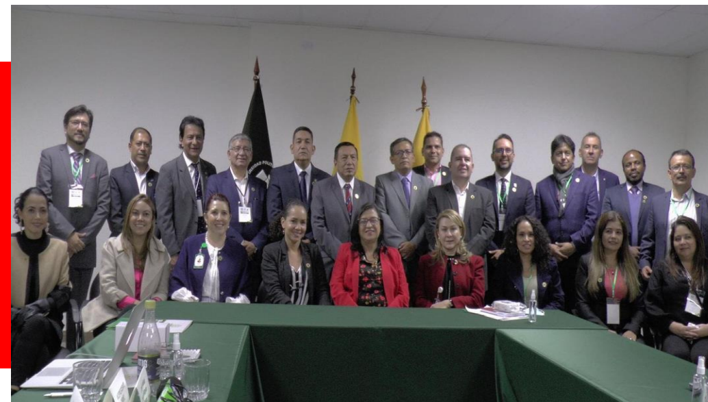
Encuentro Integrantes REDEC

RECTORA PRESIDENTA CONSEJO EJECUTIVO DE LA RED DE INSTITUCIONES DE EDUCACIÓN SUPERIOR DE ECUADOR Y COLOMBIA