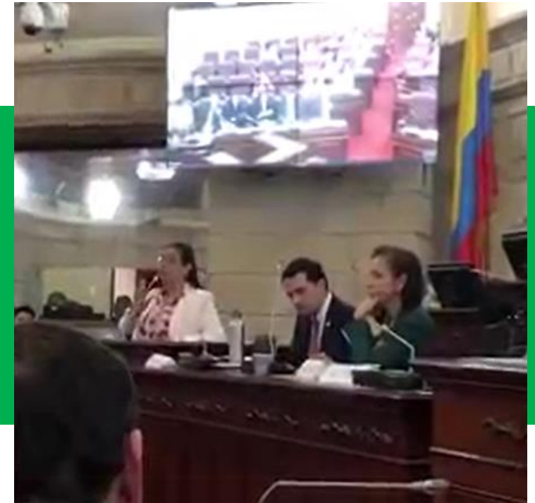
Representación de la Universidad de Nariño en diálogo por la Educación Superior en el Congreso de la República.