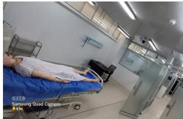
Laboratorio Simulación Medicina $3.056.680.048