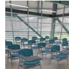
Dotación MARAGRÍCOLA $519.980.490