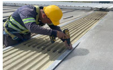
Plan de Mantenimiento $556.000.000