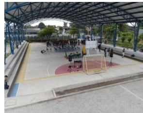
Áreas Exteriores Tumaco $1.448.421.150