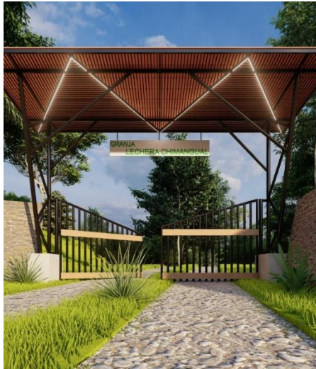
Portadas Granjas Universitarias $ 194.604.553