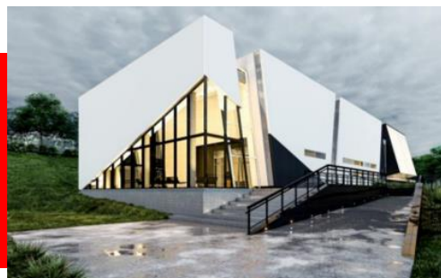
PLANTA PILOTO PASTO INVERSIÓN: $10.000 MLL