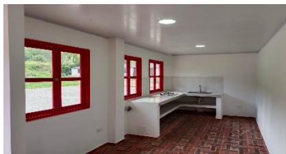
Alojamientos Botana $115.971. 047