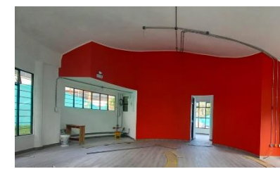
Librería Universitaria $305.554.187