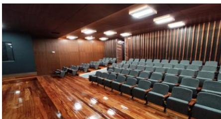
Auditorio y Oficinas Bloque 1 Sur $1.251.248.290,18