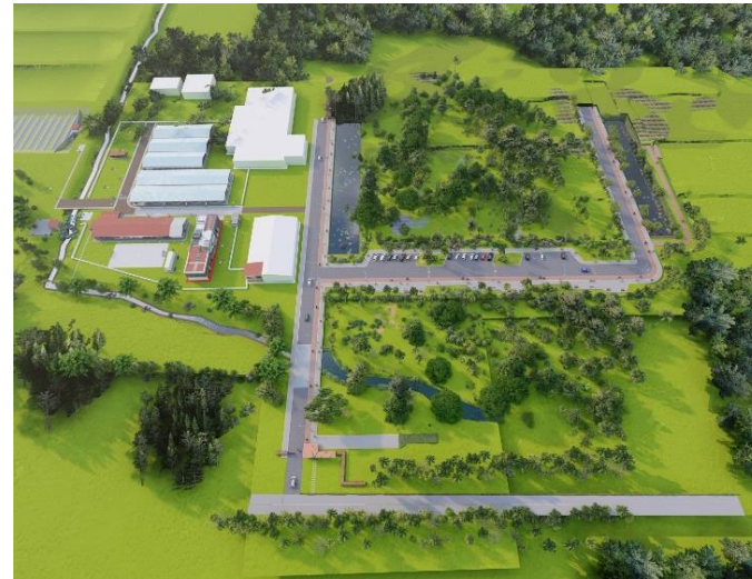
Áreas Libres Maragrícola $3.100.000.000