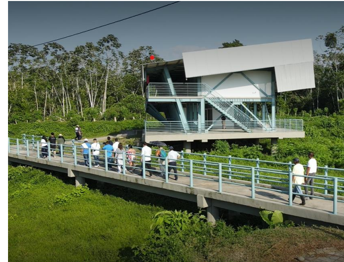
Dotación Maragrícola $13.000.000.000