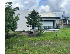
Nuevas Aulas Tumaco $1.103.464.981