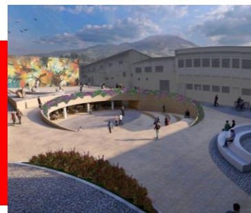
ARCHIVO CENTRAL PASTO INVERSIÓN: $6.000 MLL