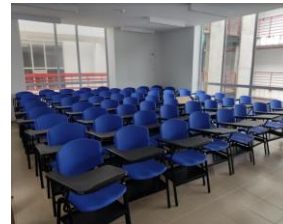
Dotación Aulas BI 1 SUR $270.069.620