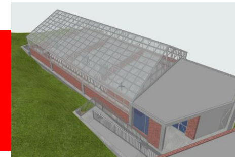
INVERNADERO INVERSIÓN: $936.000.000