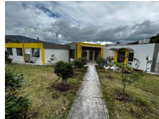
Clínica Veterinaria $1.074.063.629