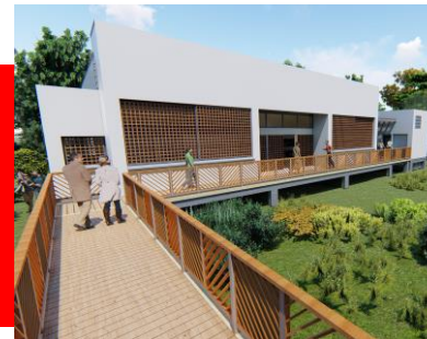
BIBLIOTECA SEDE CIUDADELA TUMACO INVERSIÓN: $1.220.786.935