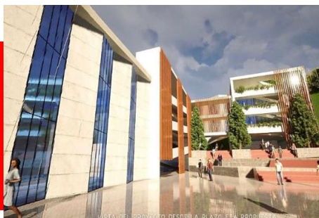
NUEVA FACARTES PASTO INVERSIÓN $12.500 MLL