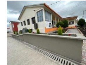
Exteriores Túquerres $ 266.167.470