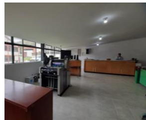
CEPUN $ 79.230.632